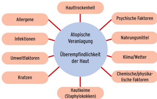
Abbildung 1: Faktoren mit Einfluss auf den Zustand der Haut

Entstehung und Verlauf der AD sind von verschiedenen Faktoren abhängig. Im Vordergrund steht die genetische Veranlagung mit Besonderheiten des Immunsystems. Viele verschiedene Genotypen sind in unterschiedlicher Zusammensetzung Grundlage für eine erhöhte kutane Empfindlichkeit, Einschränkung der lokalen Abwehrfunktion sowie eine gestörte Barrierefunktion der Haut. Immunologische Besonderheiten von Patienten mit AD umfassen vor allem eine Stimulierung von T-Helfer-Typ-2-Lymphozyten mit einem spezifischen Muster an Zytokinen (IL-4, IL-5, IL-13). Dies resultiert unter anderem in einer Hochregulierung von Eosinophilen und Langerhans-Zellen. Letztere sind fähig, Allergene via spezifische IgE-Antikörper den T-Zellen zu präsentieren. Folge ist eine Stimulation der Lymphozyten mit Inflammation der Haut (6). Neben diesen genetischen und immunologischen Besonderheiten beeinflussen verschiedene intrinsische und extrinsische Faktoren den Verlauf der AD in einem komplexen Zusammenspiel (Abbildung 1). Sie sind aber nicht primär Ursache der AD, sondern wirken vor allem krankheitsmodulierend.